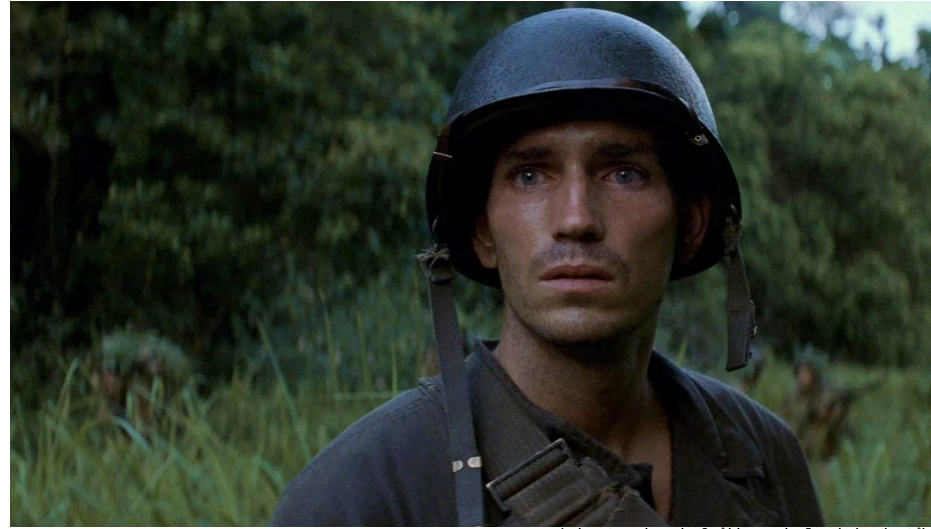
«Jeg har set en anden verden. Også i denne verden. En verden hvor ting stråler», sier soldaten Witt i The Thin Red Line.

Denne tanke slog mig da jeg forleden genså Terrence Malicks The Thin Red Line (1998), en film om en amerikansk miljøtærenheds bestræbelse på i direkte konfrontation med den japanske hær, at indtage stillehavens Guadalcanal i 1942 i det tropiske Melanesien. Det er også historien om den gode, kampstærke soldat Witt, der ender med at desertere.