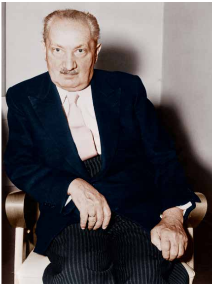
Den tyske filosofen Martin Heidegger [1889–1976] i 1959.