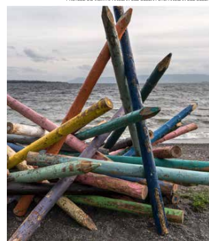
TIMMERBELVÆNTENE AV MARIANNE STRANGERE