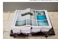
MØSTIKK AV WENCHE KVALSTAD ECHOW