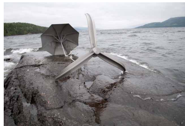
HIMMELEN ER SKYET AV EIGD MARTIN KULLØEN