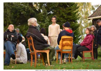
FRISA MJØSA TIL ØSTFJORD-HAVET AV JANA WINDGREEN