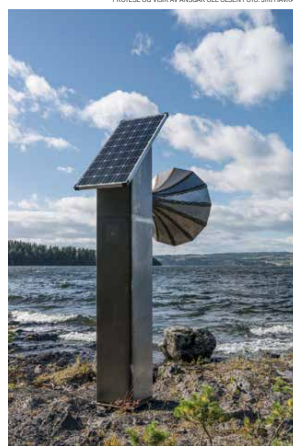
LYDEN AV TÅKE AV HILDE AAGAARD