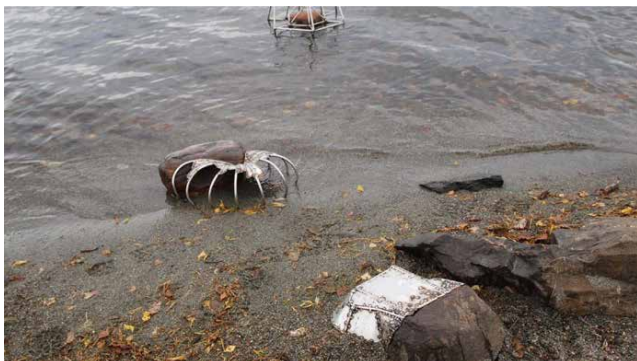
PROTESE OG VISIR AV ANSGAR OLE OLSEN