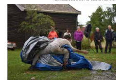
FRISA MJØSA TIL ØSTFJORD-HAVET AV JANA WINDGREEN