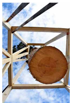
VERDENS ENDE AV MARKUS LI STENSRUD