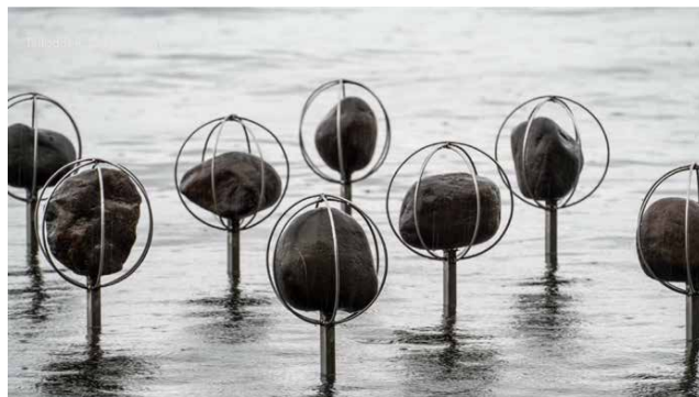
HIMMELEN ER SKYET AV EIGD MARTIN KULLØEN