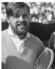
VI ER LEVENDIGE

Livsundren. Torben Ulrich, tennisspiller (Danmarks-mester og 100 Davis Cup kampe for DK, højest rangerede seniorspiller i verden 1976), jazzskribent i flere årtier (fra 1940'erne til 60'erne især), tibetansk buddhist, maler, forfatter, fritrækker, læg hertil selvstudier i musik, filosofi, litteratur, billedkunst, fysik, økologi, litteratur, visdomstænkning, mystik, yout name it. Hvad forener det hele? Undren. Livsundren. At være til. At være levende. At lytte til universet, lige her, i barnets leg. I jазzen, i spillet, mens bolden kommer. Han ville