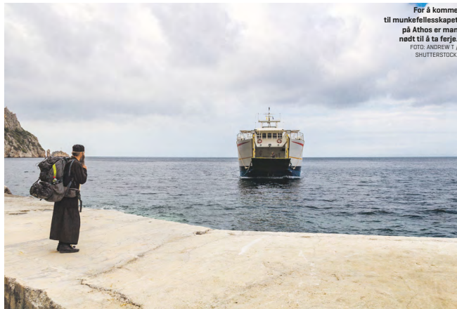
For å komme til munkeløskøpet på Athos er man nødt til å ta ferje.

Mange kunstnere i Vesten har hentet afgørende inspiration fra østkirken. For den svenske digter Gunnar Ekelöf, hvis Diwan-trilogi er en bearbejdning af østkirkenes ikoner, er selve bevægelsen mellem det figurative og nonfigurative det centrale.⁴ Demmed forholder han sig kritisk til den del af den ortodokse kirke hvor billedrytens tendenser at forblive abstrakt og fjern uden mulighed for forvanding. Billedets forvanding fremhæver ikke kun noget usynligt, men er også et udtryk der har spillet om menneskeligt liv