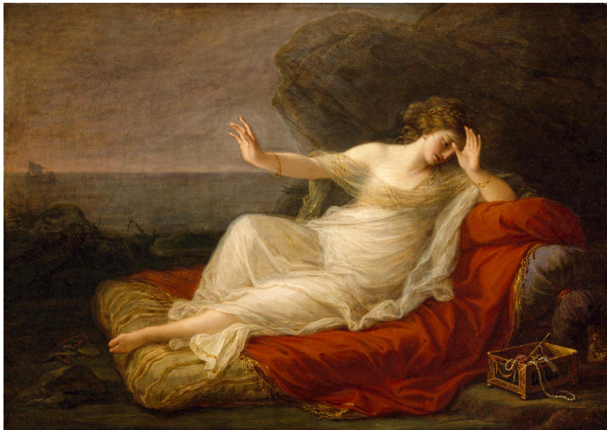
ANGELICA KAUFFMANN, ARIADNE FORLÅTT AF THESEVS, 1774.

nat sneget sig efter dig ind i din ensomste ensomhed og sagde til dig: «Dette liv, du nu lever og har levet det, skal du leve endnu engang og utallige gange ... og det vil intet nyt være i det, men hver og smerte og hver en lyst og hver en tanke og hvert et suk og alt usigelig småt og stort i dit liv skal vende tilbage til dig, og alt sammen i den samme rækkefølge – og således også dette minde mellem træerne og dette øjeblik og jeg selv.»