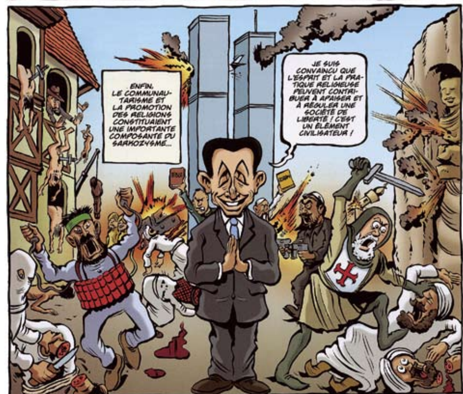
Albumet La face karchée de Sarkozy angriper Nicolas Sarkozys image som anti-establishment (illustrasjon: Riss).