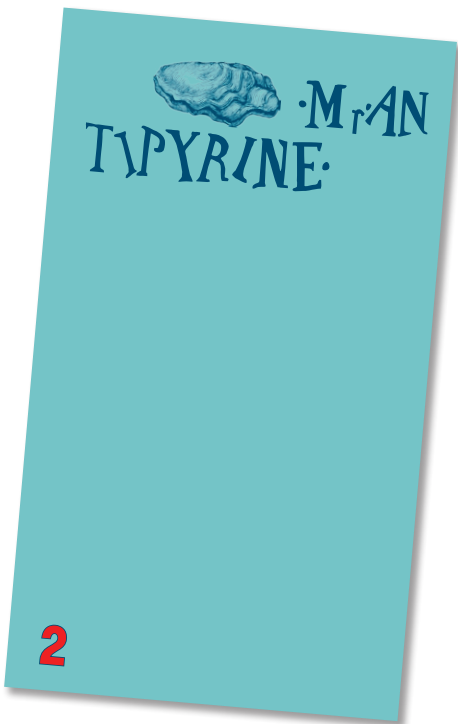
Monsieur Antipyrene, nr. 2, 2015.

Monsieur Antipyrene gør det igen relevant at stille spørgsmålet hvem det er der skriver historien: Fornuften, arbejderen, revolutionen? Hardt og Negris sociale multitudine skabte ikke nogen revolution. Ej heller den kreative klasse der ligner en uforpligtende leg. Men det store spørgsmål er hvordan denne «nye sociale organisation» kaldet Monsieur Antipyrene kan undgå at ende som en ny æstetisk kapitalismekritik? Måske den eneste kur er at foreslå alle danskere, inklusiv Monsieur Antipyrenes egne venner, at tage et år fri og udføre socialt arbejde for