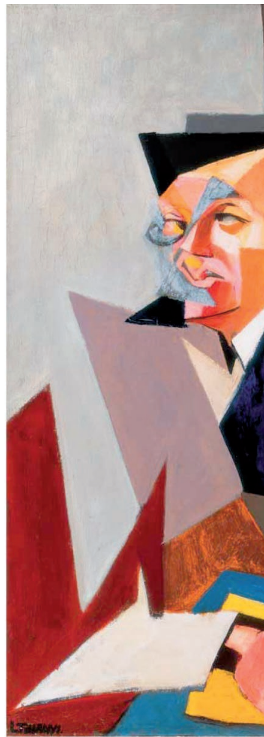
PORTRETT AV TRISTAN TZARA, LAJOS TIHANYI, 1927.

Apropos innovation, hvor finder vi en tankens nyhed? Det gør vi i eksilet, det gør vi i anonymiteten, det gør vi i den daglige gøren. Så, hvorfor ikke overgive sig til noget helt andet og derigennem ændre sin opmærksomhed på verden og tingene? At bringe sin egen plads i bevægelse. Selv romantikken kan hos Monsieur Antipyrine indtage en plads uden længere at være sig selv. Ikke længere at tænke sig selv til ende, modsat kynikeren der altid finder det han søger. Eller oplysningsfilosoffen der stiller sig tilfreds med rettinger og indtagelsen af en position hvorfra han dømmer. Men ikke hos Monsieur Antipyrine , her tænker man sig selv delvis væk, måske fordi man hengiver sig til noget, måske fordi man er ramt af noget – af en kærlighed til verden? Udfordringen for Monsieur Antipyrine er ikke at ende som «radikal teori» eller «smal litteratur», men bevare en undren der grænser op til