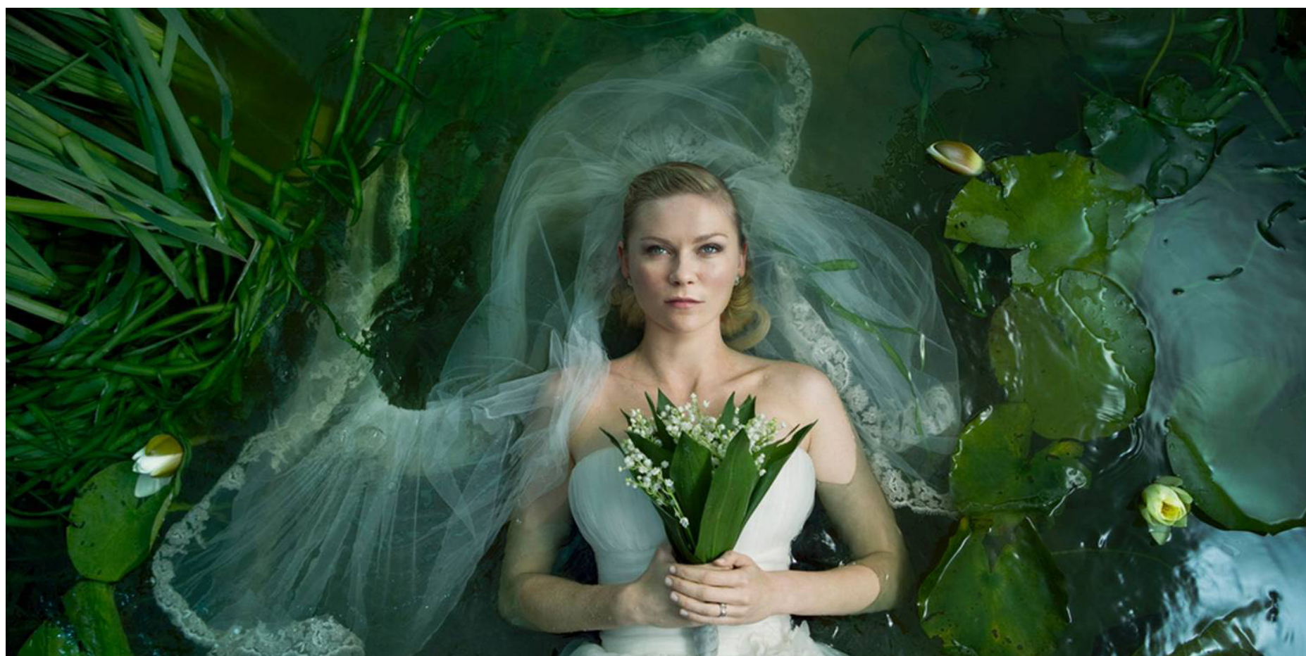
Justine, hovedpersonen i Lars von Triers Melancholia .