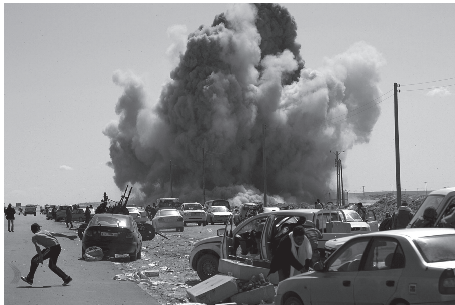
Libya 2011.

På norsk militær side fantes en uro over konsekvensene. Den 1. august, midt under krigen, avsluttet Norge bombing. De norske F-16-flyene ble bedret hjem. Jens Stoltenberg hadde skjont å krigen fulgte en annen agenda enn FN-resolusjonen. Norge hadde gått inn i krigen